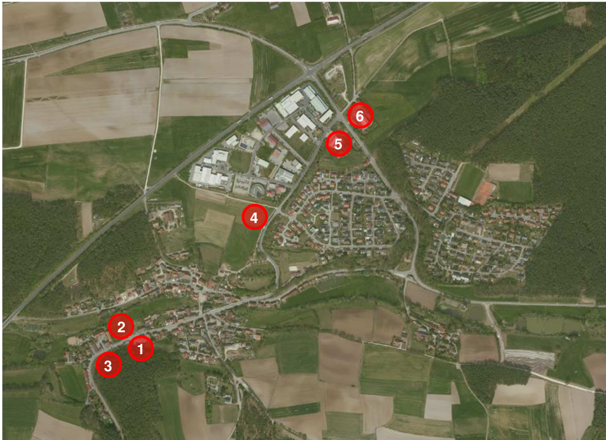
Abbildung 2: Übersichtsplan Standortalternativen Barthelmesaurach (ohne Maßstab)

Am jetzigen Standort der Grundschule Kammerstein in Barthelmesaurach ( Standort 1 ) ist eine bauliche Erweiterung nicht bzw. nur eingeschränkt möglich. Aufgrund der geringen Grundstücksgröße ist hier eine Realisierung des notwendigen Raumprogramms entsprechend den Anforderungen der bayerischen Schulbauverordnung (SchulbauV) sowie die Umsetzung neuer pädagogischer Konzepte für einen zukunftsfähigen, nachhaltigen Lernort nicht möglich. Spätere Erweiterungen, beispielsweise für Ganztageskonzepte, können am Standort 1 nicht realisiert werden. Die Waldflächen südlich des Standorts sind Teil des großräumigen Landschaftsschutzgebiets „Südliches Mittelfränkisches Becken westlich der Schwäbischen Rezat und der Rednitz mit Spalter Hügelland, Abenberger Hügelland und Heidenberg“ (LSG West) und kommen damit für eine Standorterweiterung nicht in Frage.