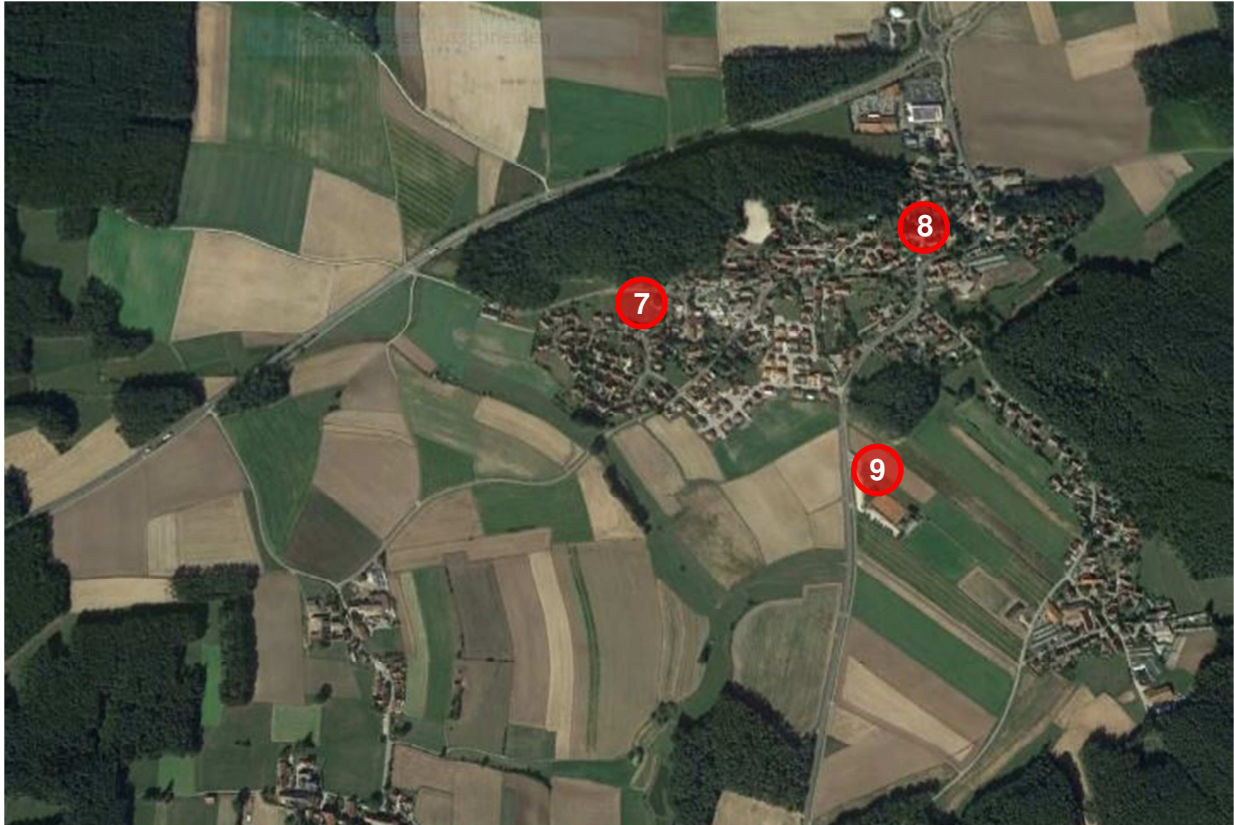
Abbildung 3: Übersichtsplan Kammerstein (ohne Maßstab)

Hiervon befinden sich zwei Grundstücke im Bereich der bebauten Ortslage (Standorte 7 und 8) und eines am südlichen Ortsrand im Bereich des Sportgeländes (Standort 9).