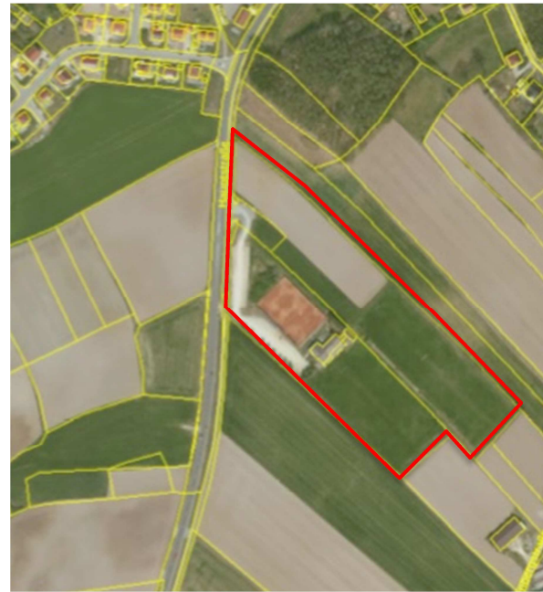
Abb. 4: Lage Standort 4 (Barthelmesaurach) Abb. 5: Lage Standort 9 (Kammerstein)

Beide verbliebenen Standorte sind aufgrund der vorhandenen Strukturen in der Umgebung dem Außenbereich gemäß § 35 BauGB zuzuordnen und erfordern deshalb die formelle Durchführung eines Bauleitplanverfahrens zur Sicherung der städtebaulichen Entwicklung und Ordnung unter Abwägung der planungsrelevanten Kriterien.